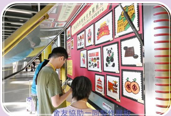
舍友協助一同製作展板