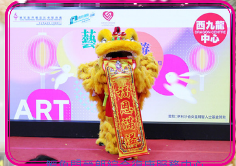
鯉魚門晉朗綜合復康服務中心派出醒獅隊為開幕剪彩助興

由伊利沙伯女王弱智人士基金贊助的「藝韻悠遊」之成果展覽暨交流同樂日已於2025年10月8日順利舉行，當日鯉魚門晉朗綜合復康服務中心派出醒獅隊為開幕剪彩助興，一眾參與過去基金贊助藝術課程的會員展示自己藝術作品及到台上表演，表演項目包括非洲鼓、小結他、K Pop及band show，節目精彩豐富。同場舉行藝術工作坊及展出過去參與藝術課程會員的作品，特別鳴謝西九龍中心當日免費借出場地予本單位舉行活動。