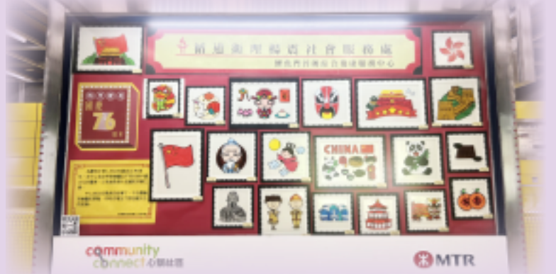
畫作展示在港鐵油塘站內的展板