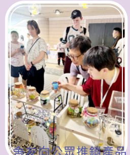
舍友向公眾推銷產品

最後，中心成功向港鐵公司申請展板，於十月份向公眾展示舍友的畫作。適逢十月一為中華人民共和國成立76周年，中心的舍友特意繪畫出不同代表中國文化的圖案，以表達對偉大祖國的仰慕之情。舍友不但體驗到繪畫的樂趣，同時亦增加了對祖國文化的認識。