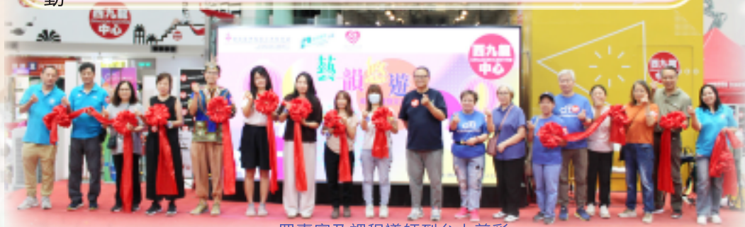
一眾嘉賓及課程導師到台上剪彩