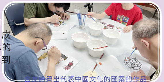
舍友繪畫出代表中國文化的圖案的作品

最後，中心成功向港鐵公司申請展板，於十月份向公眾展示舍友的畫作。適逢十月一為中華人民共和國成立76周年，中心的舍友特意繪畫出不同代表中國文化的圖案，以表達對偉大祖國的仰慕之情。舍友不但體驗到繪畫的樂趣，同時亦增加了對祖國文化的認識。