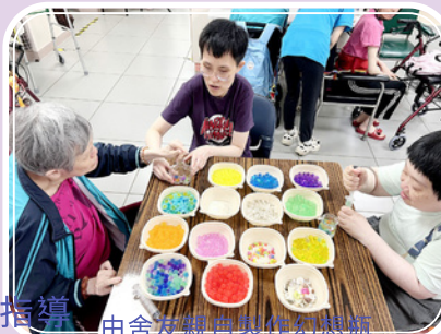
由舍友親自製作幻想瓶