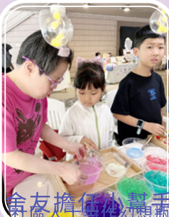
舍友擔任小幫手指導 社區人士製作幻想瓶

了由香港心理衛生會主辦的「mha·創意墟」手作市集，售賣由舍友利用水晶寶寶及不同素材製作而成的幻想瓶。為期兩日的市集中，舍友除了參與銷售的過程，親自向公眾人士介紹自己的製作概念和推銷幻想瓶，並於即場製作區擔任小幫手，指導社區人士製作獨一無二的幻想瓶。整個市集，能讓社區人士與殘疾人士有更多的正面互動，讓舍友建立正面的自我形象，達至傷健共融。