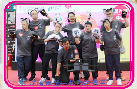
深晴舞團一眾同學表演