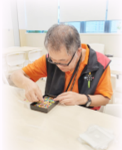
舍友參與日常康樂活動

悅欣居致力於創建一個友善和包容的居住環境，讓肢體傷殘及智障人士能夠享受更高質素的生活，達到「獨立」、「互助」和「支援」。透過多樣化的服務，指導及支援不同需要的服務使用者，為殘疾人士的生活帶來積極的變化。