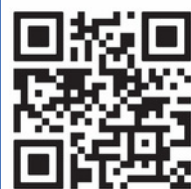
《揚帆生活Yanger Life》 網頁

循道衛理楊震社會服務處成立於1967年，是一間多元化的社會福利服務機構，服務類別包括長者、青少年、家庭、殘疾人士等，以「奉行基督信仰價值，實現公義關愛社會」為願景，透過各類活動與服務使用者同行。本處希望打破傳統以來服務使用者只接受服務的觀念，透過他們親手製作的手工藝品，發揮出不同人士的能力與所長；藉著產品述說他們的故事。2022年本處成立《揚帆生活 Yanger Life》網上銷售平台，讓社會大眾可以透過購買產品，直接支持社會服務，並以服務使用者的故事互相勉勵！《揚帆生活Yanger Life》所有收入扣除產品成本後，將用於支持本處繼續推行社會服務及支付產品的製作人，鼓勵自力更生！所有產品由選料到製作均為服務使用者親手製作，萬勿錯過！