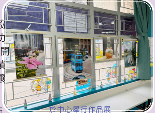
於中心舉行作品展

作品展於2025年9月尾完成。同時接獲國際兒童文化藝術發展協會通知，其中一位舍友的作品成功於「2025國際旅遊攝影大賽」公開組奪圍而出，獲得金獎殊榮，成績令人鼓舞，期待未來有更多機會讓舍友發展所長。