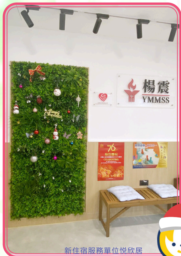
新住宿服務單位悅欣居

住宿服務增添了一個新單位— 悅欣居，今期家友天地將會詳細為 大家介紹這個新服務，如果你也有興趣 就不要錯過今期的內容，另外，記得 翻到期刊的最後兩頁，一起動動手完 成簡單的小手作，期待大家的作品！